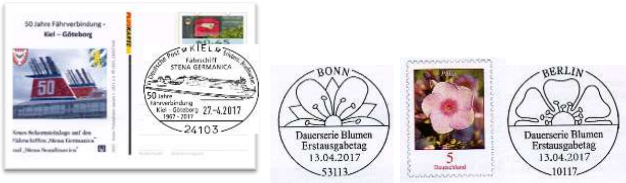
Ganzsache GS-PK ATM