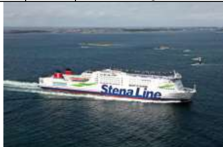
GS bzw. FU 1)