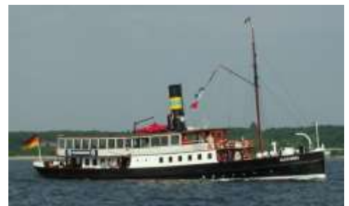
Nordische Jagt GRÖNLAND