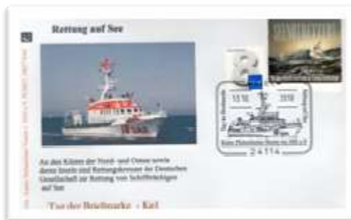
der schöne Festumschlag