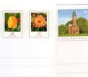
Pluskarte LT Kiel-Holtenauj