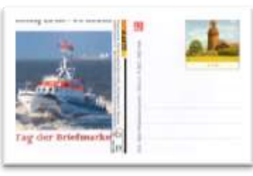
Pluskarte LT BUK