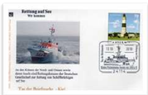
Ganzsache 1) Kampen