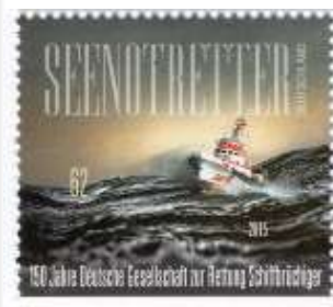
die rare Sondermarke