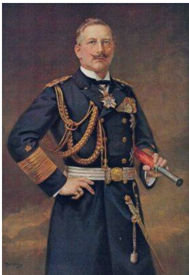
Kaiser Wilhelm II in Kieler Admiralsuniform

Das ist der Grund, warum der Sonderstempel in Barneveld/Niederlande den Ortsnamen „Kiel“ im Stempelkopf erhält.