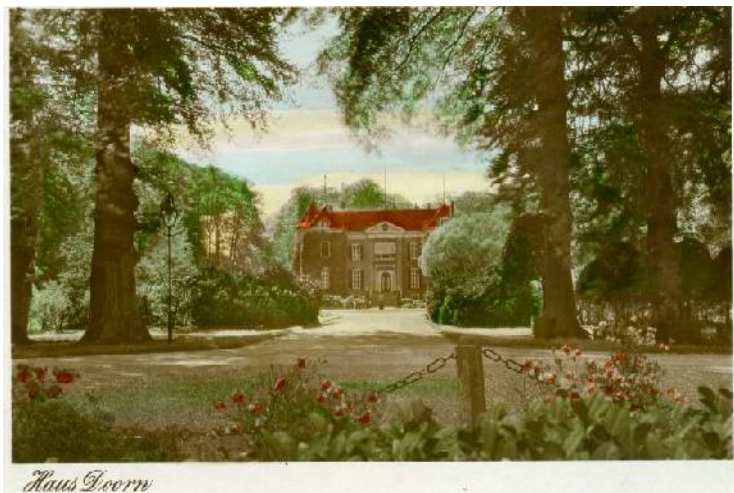
Exilsitz: Schloss Doorn / Niederlande